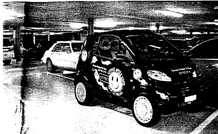
Après les places Vel destinées aux véhicules électriques, Sion poursuit son développement de mobilité urbaine avec les places supercompactes.

Dix places, dans les parkings du Scex et de la Cible, à disposition des propriétaires de petites voitures.