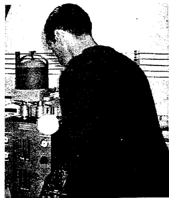
de la recherche appliquée en

d'intégration était à notre charge. Le produit est commercialisable.» Cet entrepreneur, très satisfait de son expérience, a fait ressortir en filigrane quelques pièges à éviter: «L'industriel doit être clair dans ses objectifs et ne pas oublier que ses partenaires scientifiques ne parlent pas forcément le même langage que lui. La démarche suppose un risque, il n'y a pas de garantie de réussite avant de lancer la recherche. Pour mettre les chances de son côté, il faut s'investir, créer un groupe de projet et s'assurer la maîtrise des données à la fin du projet.»